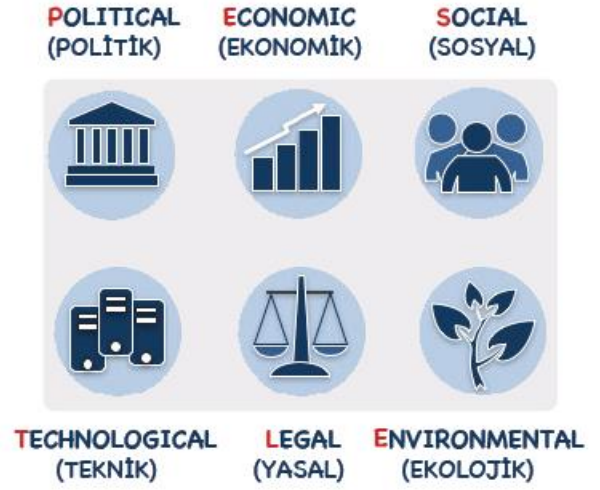
Tablo 20. PESTLE Analiz Tablosu

Bu matriste PESTLE unsurları içerisinde gerçekleşmesi muhtemel olan hususlar ile bunların gerçekleşmesi durumunda Müdürlüğümüz için oluşturacağı potansiyel “fırsatlar ve tehditler” ortaya konulmuştur. Bu çalışmayla elde edilen bulgulara Tablo 20’de yer verilmiştir. Ayrıca; bu analiz sonucunda ortaya çıkan bulgular “tespit ve ihtiyaçlar” ile stratejilerin geliştirilmesi aşamasında kullanılmıştır.